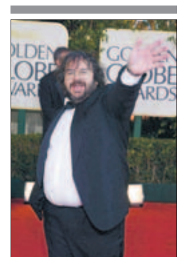
Uusiseelantilainen ohjaaja Peter Jackson vei parhaan ohjaajan Golden Globe -palkinnon elokuvastaan Kuninkaan paluu.

• Lisätietoja: http://kamy.animeunioni.org tai www.animeunioni.org