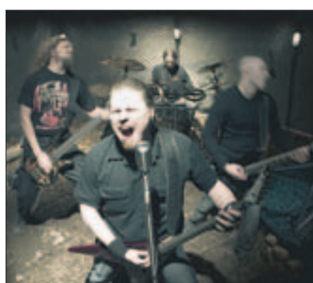
Diablon Eternium loikkasi albumilistan kolmanneksi.