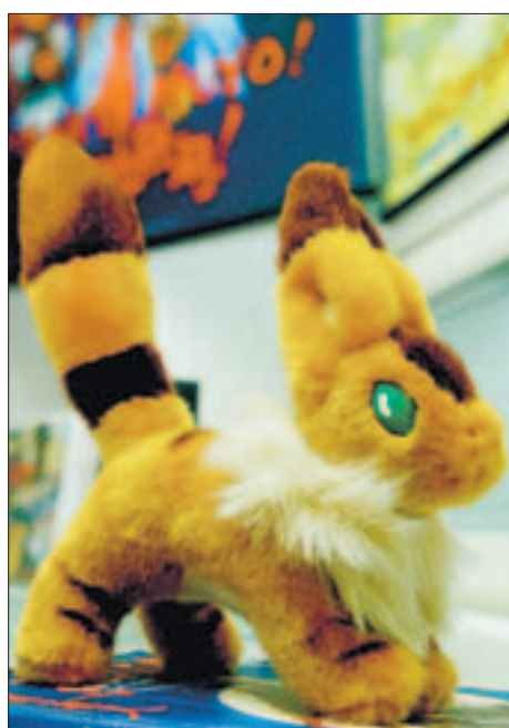
Kettuorava on tyypillinen japanilainen oheistuote: Outo eläin – söpö, suurisilmäinen hahmo.

Kamyn porukoiden kesken harrastajat pitävät videoitaja, puhuvat sarjakuvista ja käyvät vilkasta nettikeskustelua.