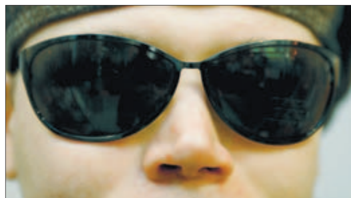
Mitä suuremmat aurinkolasit, sitä paremmin ne huomataan.

Muovimallistot ovat ovat pääosin naisille; miehet käyttävät enimmäkseen metallisia. Molemmista mallistoissa käytetään usein 1970-luvulta peräisin olevaa kak-